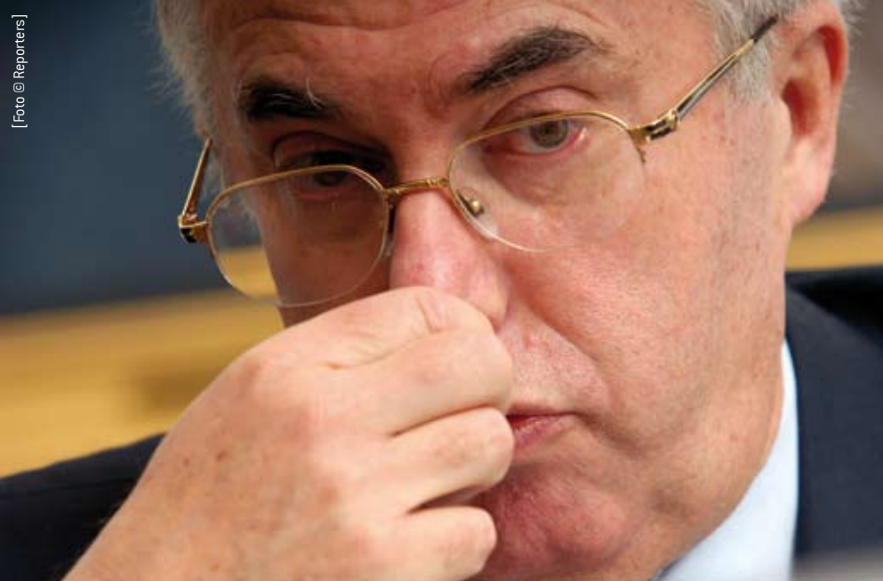
Guy Quaden (Nationale Bank) knijpt in opdracht van PS neus dicht voor Vlaamse meerderheid.

Japan (60,1), VS (56,5), Frankrijk (54), België (52), het VK (49,8). Minst kwetsbaar in de EU zijn Denemarken en Zweden. Bij Vives, het Vlaams Instituut voor Economie en Samenleving in Leuven zoemt het gerucht dat er een eigen 'vulnerability/kwetsbaarheids'-graadmeter in ontwikkeling is.