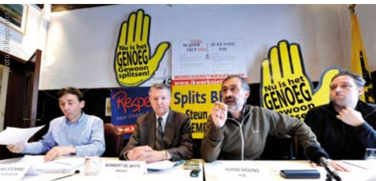
De werkgroep BHV blijft de dienstweigeraars met raad en daad steunen.

Op 13 juni 2010 weigerden 298 Vlaamse burgers dienst. Ze werden opgeroepen om te zetelen als voorzitter of bijzitter in een stem- of telbureau en weigerden daaraan gevolg te geven omdat de verkiezingen ongrondwettig waren zonder splitsing van BHV. Daartoe kregen ze de nodige steun van de werkgroep BHV (een samenwerking van het Halle-Vilvoorde Komitee, de Vlaamse Volksbeweging en het Taal Aktie Komitee). Van die 298 effectieve dienstweigeraars kwamen er 121 in contact met de politie of het gerecht. Na verhoor is er in 57 gevallen een rechtszaak aanhangig gemaakt: 8 in Leuven, 25 in Oost-Vlaanderen, 14 in West-Vlaanderen, 6 in Antwerpen en 4 in Limburg. Opmerkelijk is ook dat er tot nu toe niemand is gedagvaard in Halle-Vilvoorde zelf. Naast die 57 vervolgingen zijn er ook 7 zaken gese-