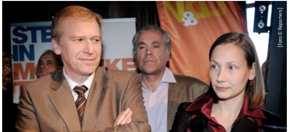
Yves Leterme (links) en Inge Vervotte (rechts): leidende figuren van 'staatsdragende' partijen beseffen dat er geen plaats meer is in een regering van zes partijen voor vijftien 'postjes'.

Yves Leterme, een man met ook ambtelijke er-