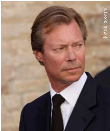
SIXTE-HENRI DE BOURBON-PARME, neef van prinses Astrid, wil maximale autonomie voor Vlaanderen én Wallonië.

Wanneer dan in Parijs een boek verschijnt dat erin slaagt afstand te nemen van dit deuntje, is dat op zich al het noteren waard. Wanneer de auteur van dat boek luistert naar de naam Sixte-Henri de Bourbon-Parme, is dat nog meer het geval. Want Sixte-Henri is niet alleen het enfant terrible van de Europese vorstenfamilies, hij is daarenboven nauw verwant met een bewoner van Laken. Zijn vader, Xavier, was immers de broer van Zita, de laatste keizerin van Oostenrijk-Hongarije, en tevens grootmoeder van Lorenz, de echtgenoot van prinses Astrid van België.